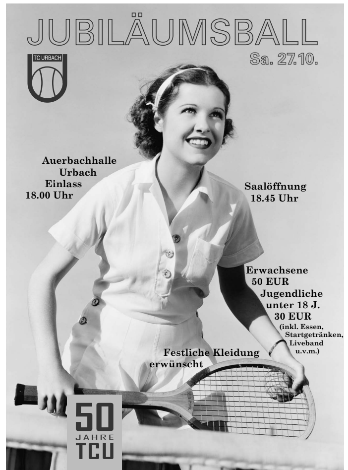
Im Rahmen eines festlichen Balls in der Auernbachhalle feiert der TC Urbach sein 50-jähriges Vereinsjubiläum.