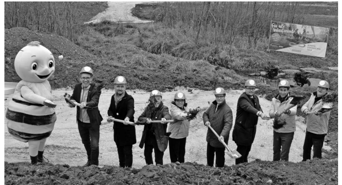
Ende des Monats erfolgt in Anwesenheit des Landwirtschaftsminister Peter Hauk der erste Spatenstich für die sog. „Stuttgarter Holzbrücke“ in der Urbacher Mitte. Diese neuartige Brückenkonstruktion aus ausschließlich heimischem Holz wird den Urbach überspannen und somit den Lückenschluss zwischen den bolzgerade durch die beiden Baugebiete Mitte I und II in Richtung Friedhof/Gänsberg durchgehenden Geh- und Radwege bilden.