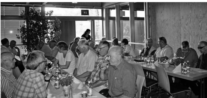
Beim jährlichen traditionellen Rentnerschoppen erfahren die Interessierten nicht nur die neuesten Entwicklungen in der Gemeinde aus erster Hand – nämlich vom Bürgermeister höchst persönlich, sondern es gibt auch immer ein gutes Vesper.