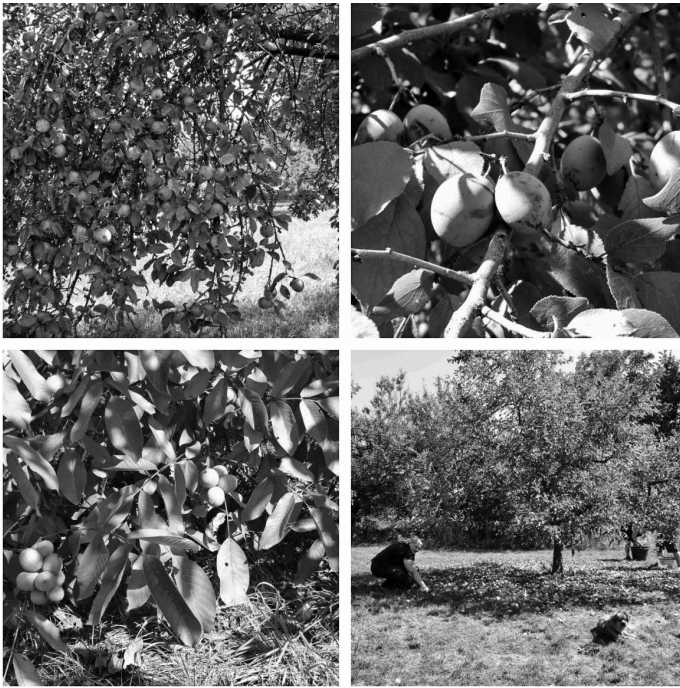
Früher als gewöhnlich endet die Obsternte in diesem Jahr. Der trocken-heiße Sommer und Herbst beschert den Stücklesbesitzern eine reiche Ernte. Die Obstannahmestellen im Ort haben alle Hände voll zu tun, den Ansturm zu verkraften.