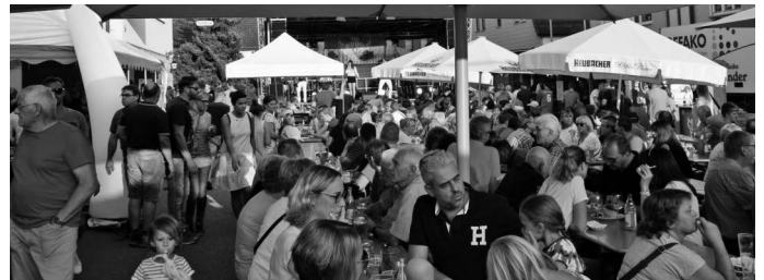
In diesem Jahr heißt es nach dreijähriger Pause für alle Urbacher und Urbacher wieder: „Auf lass' fetza“. In der Urbacher Mitte findet bei besten Bedingungen und fröhlicher Atmosphäre das zweitägige traditionelle Urbacher Straßenfest – die „Schnitzfetzed“ statt. Tolle Bands auf zwei Veranstaltungsbühnen sorgen für beste Stimmung, und die teilnehmenden Vereine, Gastronomen und anderen Gruppierungen haben eine abwechslungs- und umfangreiche Speise- und Getränkekarte im Angebot.