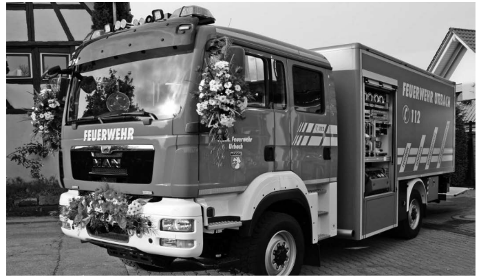
Der neue Gerätewagen Logistik der Freiwilligen Feuerwehr Urbach wird offiziell übergeben. Er ersetzt den in die Jahre gekommenen Unimog LF8.