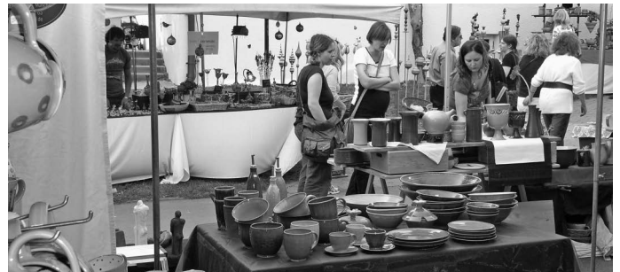
Am Ende eines für Urbach sehr ereignisreichen Monats findet wie immer der Remstaler Töpfermarkt statt. Er lockt wieder hunderte von Besucherinnen und Besuchern aus nah und fern zum Marktplatz bei Schloss Urbach.