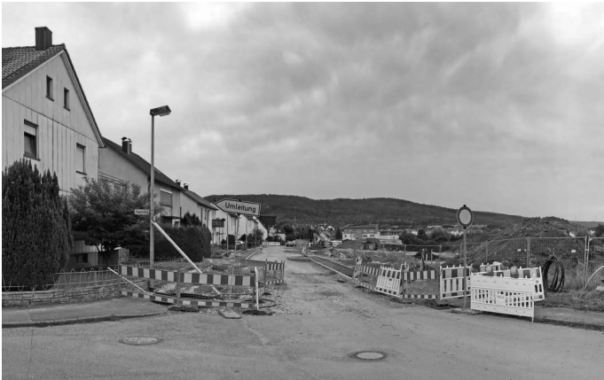
... oder der Friedhofstraße bzw. der Erschließung des Baugebiets Urbacher Mitte II