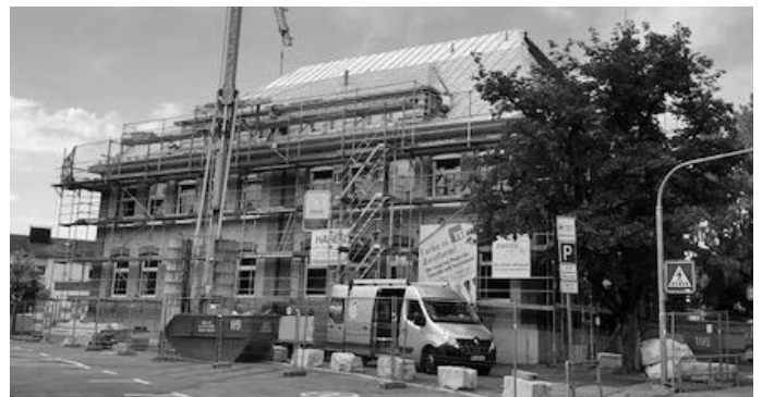
Umfangreiche Sanierungsarbeiten finden während der großen Ferien am Nordbau der Wittumschule statt. Insgesamt 650.000 € investiert die Gemeinde in die Modernisierung des Gebäudes aus dem 19. Jahrhundert.