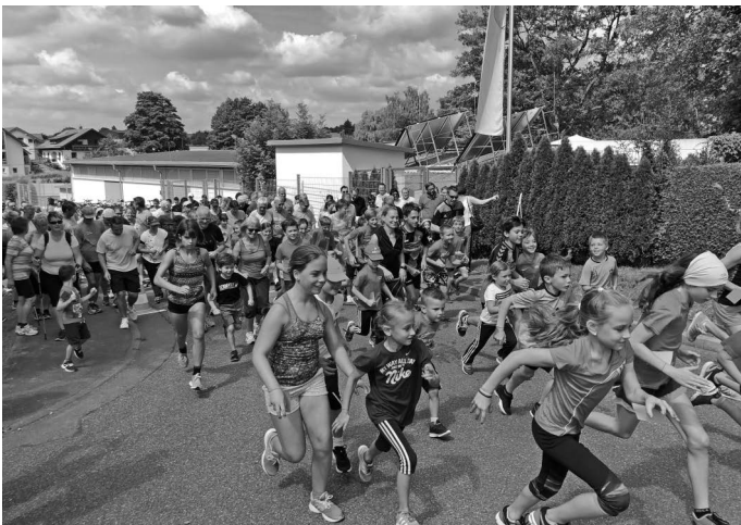
Eine tolle Stimmung herrscht beim Spendenlauf für „Bürgerstiftung Kind und Jugend“ anlässlich der Freibadhockette.