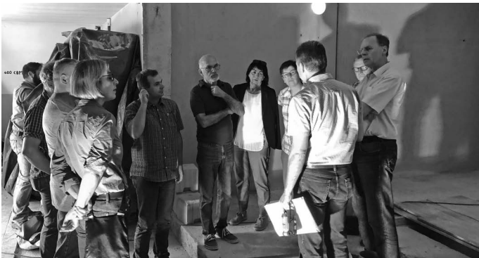
Der Gemeinderat nimmt den Umbau des Wasserhochbehälters „Unterer Leitersberg“ unter die Lupe. Dort kommt das gemeindeigene Quellwasser aus dem Bärenbachtal an und wird dem Wasser der Landeswasserversorgung gemischt.