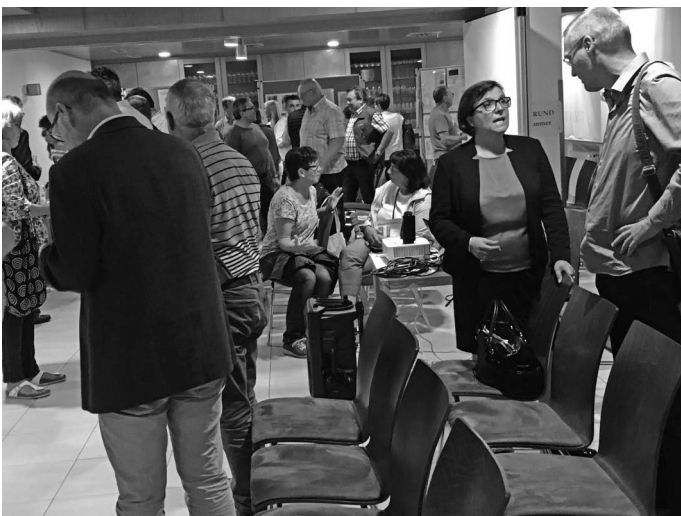
In der Auerbachhalle findet der erste Themenmarkt zu den Aktionen in Urbach anlässlich der Remstal Gartenschau 2019 statt. Befürworter und Kritiker der Gartenschau kommen bei dieser Veranstaltung wieder ins Gespräch.