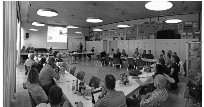
Die Gemeinderäte aus Plüderhausen und Urbach kommen nach einiger Zeit mal wieder zu einer gemeinsamen Sitzung zusammen. Dabei werden in der Wittumschule kommunalpolitische Themen erörtert, die in beiden Gemeinde von Bedeutung sind. Im Rahmen des Gedankenaustausches wird vereinbart, dass auch auf die interkommunale Zusammenarbeit wieder ein stärkeres Augenmerk gelegt werden soll.