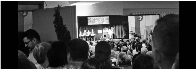
Brechend voll ist die Auerbachhalle bei der Kandidatenvorstellung zur Bürgermeisterwahl. Vielen Besuchern bleibt nichts anderes übrig als dem Geschehen in der Halle über die im Foyer aufgestellten Bildschirme zu folgen.