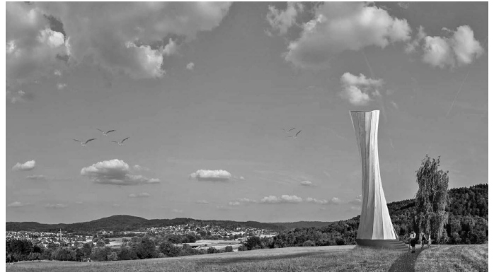
Der Turm, den die renommierte Stuttgarter Architektengemeinschaft Menges/Knipfers im Rahmen der Gemeinschaftsaktion „16 Stationen“ im Rahmen der Remstal Gartenschau 2019 für Urbach konzipiert hat, hätte eigentlich an einem der schönsten Aussichtspunkte von Urbach, am Gänsberg realisiert werden sollen. Nachdem dafür jedoch keine Genehmigung von den freien und den behördlichen Naturschutzinstanzen zu bekommen war, wird er nun an einem anderen Standort in Richtung Hegnauhof gebaut.