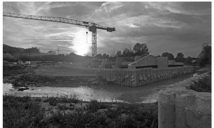
Das Sperrbauwerk am Hochwasserrückhaltebecken IV zwischen Plüderhausen und Urbach nimmt langsam Gestalt an. Die derzeit wohl größte Baustelle in Urbach soll bis zum Frühjahr nächsten Jahres fertig gestellt sein.