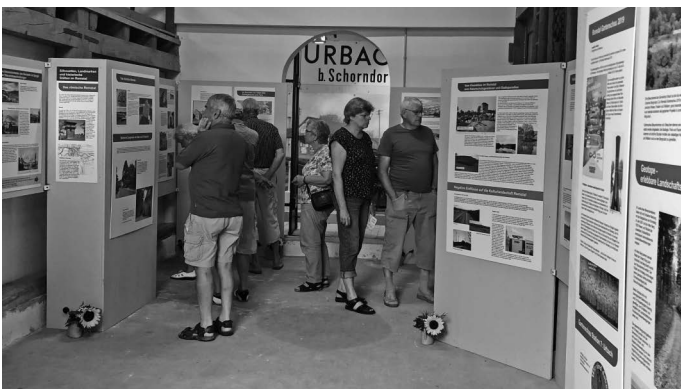
Im Museum „Farrenstall“ findet nicht nur die jährliche Hocketse des Urbacher Geschichtsvereins statt, sondern es wird auch dessen neue Ausstellung eröffnet. Sie trägt den Titel „Kulturlandschaft Remstal – gestern und heute“