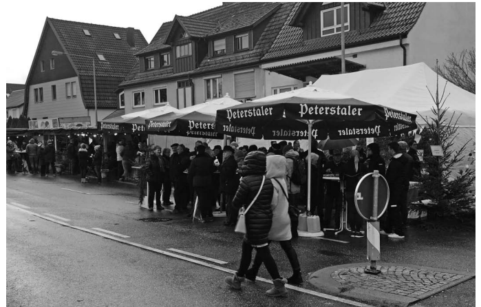
Der Urbacher Weihnachtsmarkt findet in diesem Jahr unter widrigen Wetterbedingungen statt. Böiger Wind und immer wieder mehr oder weniger starke Regenschauer ließen den ein oder anderen treuen Marktbesucher- und auch -besucher lieber daheim bleiben. Diejenigen, denen das Sauwetter egal war, hat's trotzdem gefallen auf dem Weihnachtsmarkt.