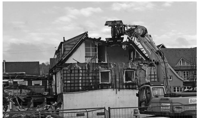
Nicht das erste Gebäude aber mit Sicherheit das letzte, das in diesem Jahr der Spitzhacke bzw. dem Bagger zum Opfer fällt, ist das „Hirsch“-Areal. Auch mit dieser Institution verbinden viele Urbacherinnen und Urbacher schöne Erinnerungen. Nichtsdestotrotz: aus jedem Ende resultiert auch ein neuer Anfang. Man darf gespannt sein, welche Ideen die Urbacher für die neu entstehende Freifläche zur Remstal Gartenschau 2019 entwickeln, bevor das Areal dann im darauffolgenden Jahr wieder bebaut werden soll.