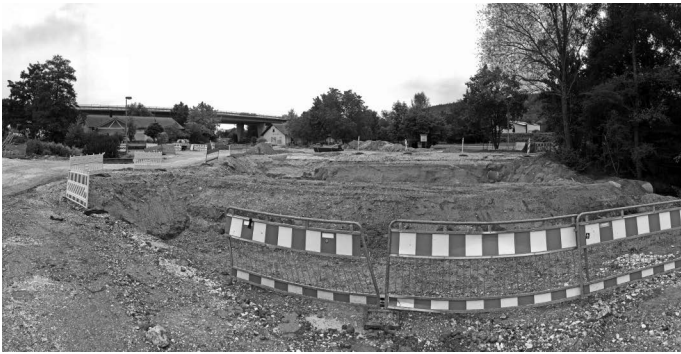
Doch nicht nur im Hochbaubereich tut sich während der Sommermonate einiges in Urbach, auch der Straßenbau läuft auf Hochtouren, hier der Ausbau der Steinbeisstraße im Zustand im August....