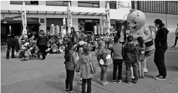
Eine tolle Aktion – Urbacher Kindergartenkinder übergeben dem Gartschau-Maskottchen „Remsi“ ihre selbst bemalten Bienen, die die offiziellen Sympathieträger der Remstal Gartenschau 2019 sind.