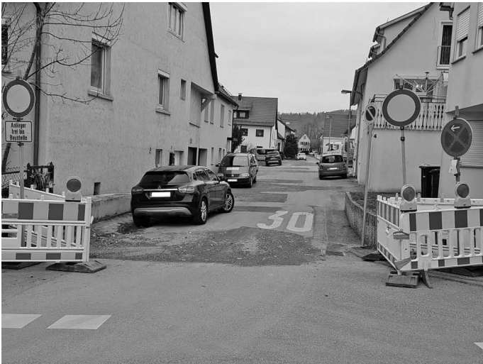
Auch in der Brunnenstraße gehen nun Bauarbeiten los. Im Abschnitt zwischen Burg- und Hohenackerstraße werden dort Wasserleitung, Kanal und nicht zuletzt auch die marode Fahrbahn erneuert.