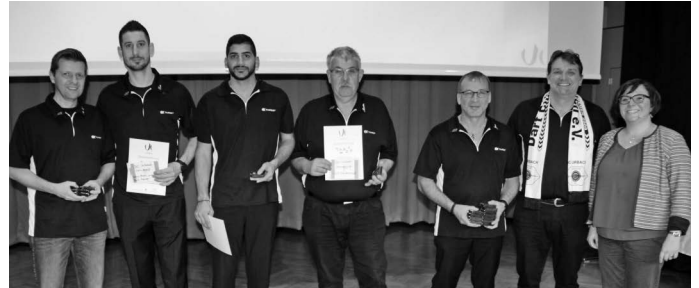
211 erfolgreichen Sportlerinnen und Sportler aus Urbach ehrt die Gemeinde bei ihrer Sportlerehrung in diesem Jahr. Herausragend ist unter anderem der Erfolg des Dartclubs Urbach, der unter anderem den Titel des Deutschen Pokalsiegers errungen hat.