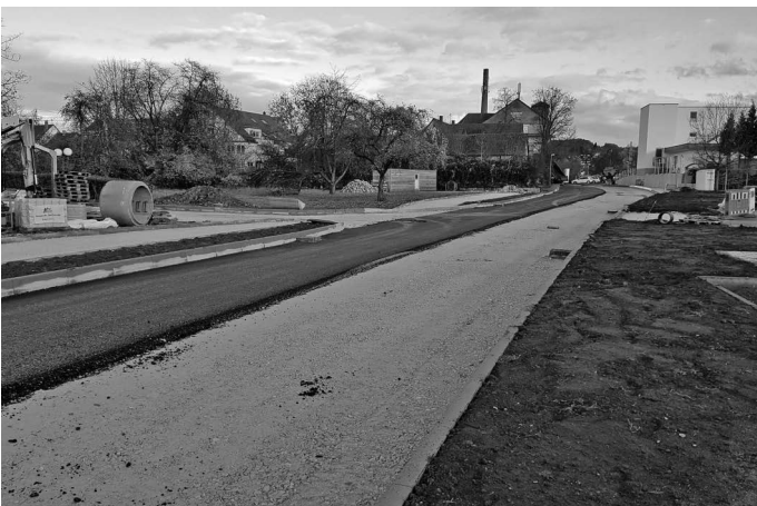
Der Ausbau der Steinbeisstraße nimmt Gestalt an – zumindest von der Raiffeisen- bis zur Konrad-Hornschuch-Straße.