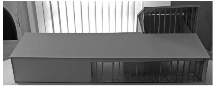
Am selben Tag wie die Bürgermeisterwahl findet der Bürgerentscheid für das Waldhaus statt. Eine deutliche Mehrheit der Urbacher Bürgerschaft spricht sich gegen den Bau des Waldhauses aus (hier ein Modell des damaligen Siegerentwurfs aus einem Ideenwettbewerb der Hochschule für Technik in Stuttgart).