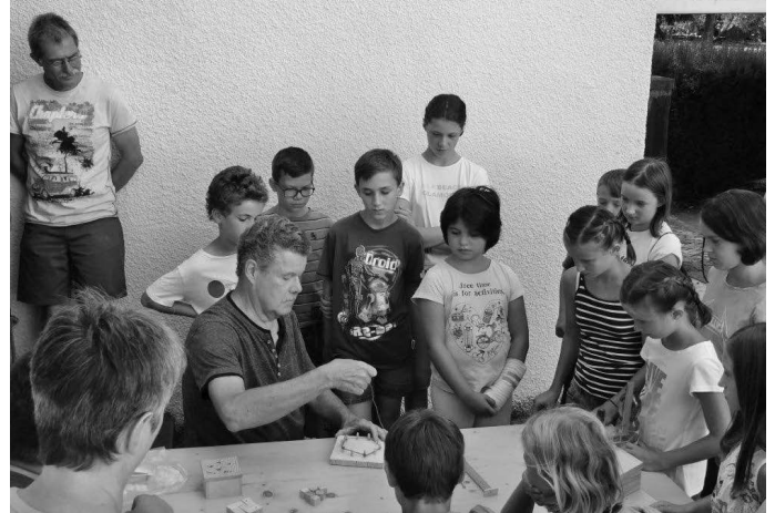
Ein Renner ist neben dem klassischen Ferienprogramm der Gemeinde und der Vereine, bei denen es wieder unter 71 Angeboten auszuwählen gilt, auch die Schülersommerferienbetreuung an der Atriumhalle. Von rund 60 Familien und bis zu Kindern wird dieses Angebot der Gemeinde in Anspruch genommen.