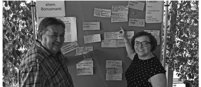
In der Atriumhalle findet die Auftaktveranstaltung der AG Nahversorgung Urbach-Nord statt. Gemeinsam wird versucht, Strategien zu entwickeln, wie man die Nahversorgung im ehemaligen Ortskern von Oberurbach retten kann. Mit dabei sind engagierte Bürgerinnen und Bürger, Ladenbetreiber sowie Mitglieder aus Verwaltung und Gemeinderat.