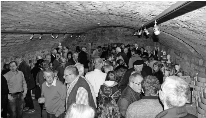
Eine Woche früher als sonst laden die Künstlerinnen und Künstler der Gruppe „MalWe“ zu ihrer Ausstellung im Museum ein. Vielfältig und wie gewohnt von außerordentlich hoher Qualität sind die Bilder, Skulpturen und das Kunsthandwerk, die dem interessierten Publikum präsentiert werden. Dieses Jahr steht die Ausstellung unter dem Motto: „Kunterbunter Genuss“.