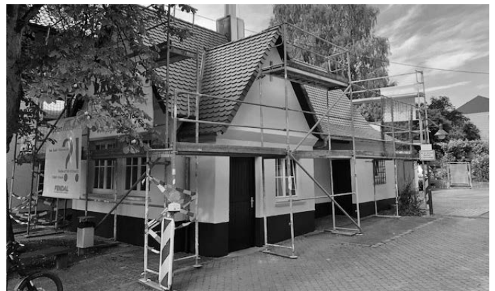
Auch das Backhaus in Urbach-Nord wird renoviert und gerüstet für den weiteren Back-Betrieb. Im kommenden Jahr sollen dort während der Remstal Gartenschau Backkurse und auch eine Hocketse rund um das Backhäusle stattfinden.