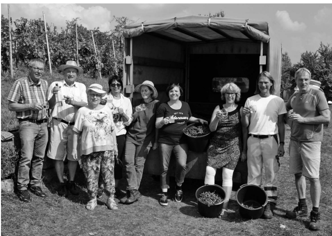
Einen guten Weinjahrgang verspricht das Lesegut, das in diesem Jahr im Gemeindewengert am Linsenberg geerntet werden kann. Die qualitativ guten Trauben werden beim Weingut Zimmer in Kernen gekeltert und zu einem süffigen Rosé verarbeitet, der allerdings nicht auf den freien Markt kommt.