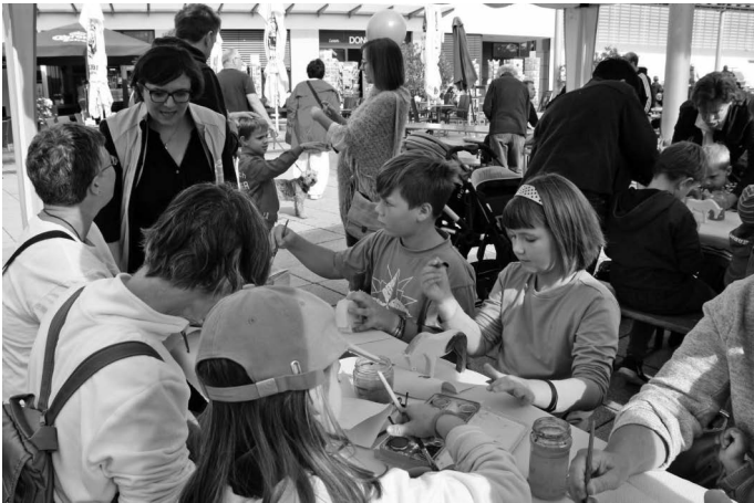
Zum Verkaufsstart der RemstalCard für die Gartenschau wird anlässlich des 10-jährigen Bestehens vom Marktplatz Urbach ein kleines Marktplatzfest gefeiert. Dabei wurden insbesondere Angebote für Kinder und Familien groß geschrieben wie hier am Stand der Firma Ostheimer, die mit ihren Holztieren auch den neuen Walderlebnispfad sponsert.