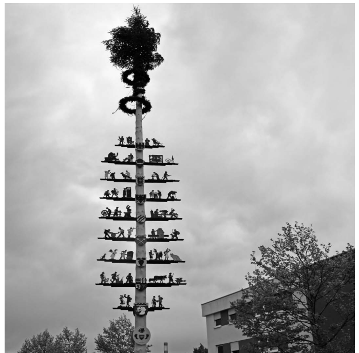
Der Urbacher Maibaum ziert wieder für einen Monat den Marktplatz in der Urbacher Mitte. Er gehört zu den größten und schönsten in der Umgebung, wie allgemein befunden wird.